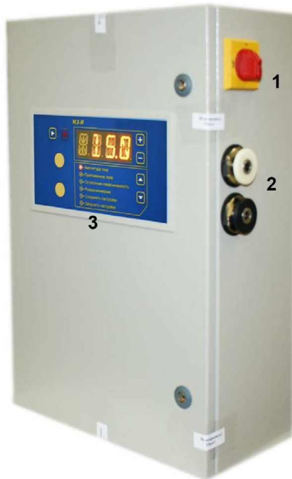
Рисунок 4.2 Внешний вид прибора СМ-20