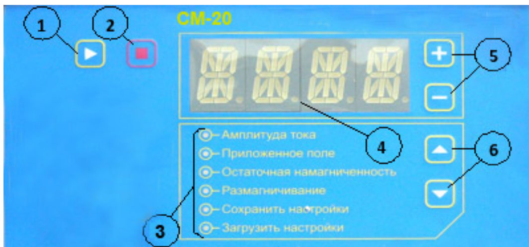
Рисунок 4.3 Передняя панель дефектоскопа СМ-20:

4 - цифровой индикатор. Указывает значение устанавливаемого тока и его тестирования «TEST», номер ячейки памяти, установку времени размагничивания, «WAIT» (ждать), «SET» (установить);